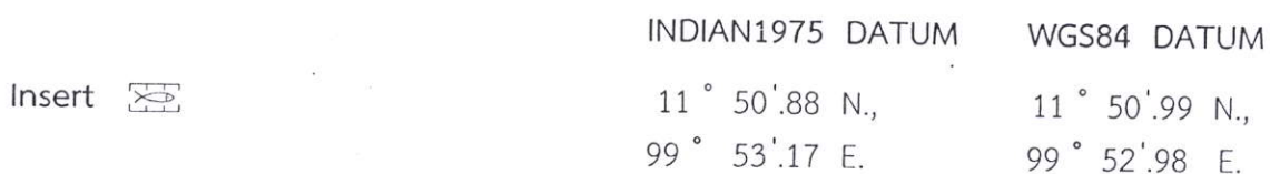
Chart No. 203 (Last correction 42/2556)